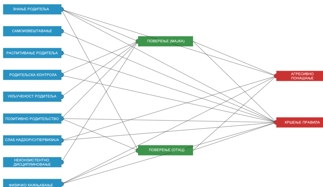
Дијаграм 3. Коначни структурални модел каузалних релација између варијабли родитељског надзора и васпитних поступака родитеља и екстернализованих проблема посредовано поверењем у мајку и оца