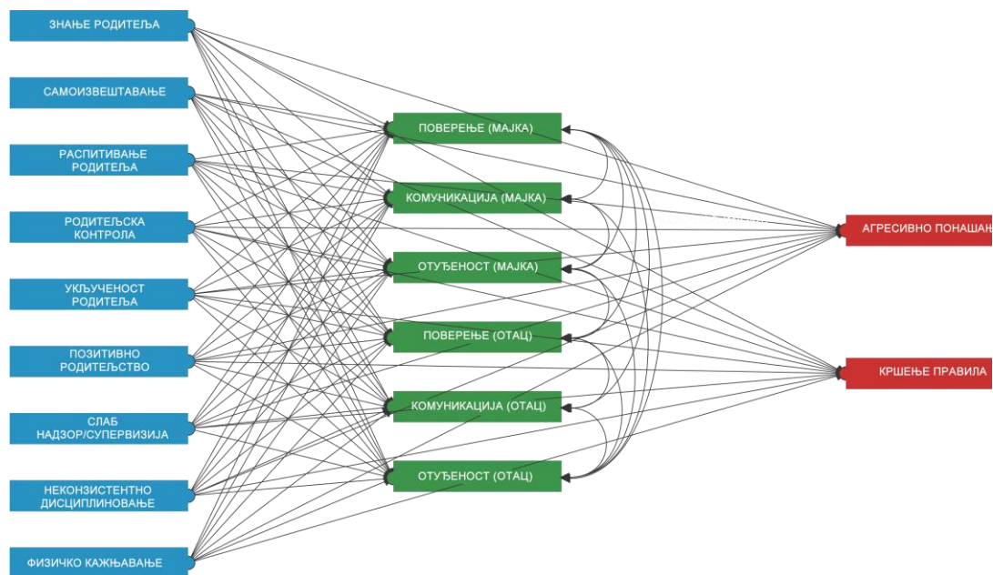
Дијаграм 1. Пун структурални модел каузалних релација између варијабли родитељског надзора и васпитних поступака родитеља и екстернализованих проблема посредовано афективном везаношћу за мајку и оца

Избацивањем свих незначајних параметара добија се модел који је информативнији за интерпретацију. Подесност модела је такође добра ( \chi^2=104.8 ; df=51 , p<.05 ; NFI=.98 ; TLI=.97 ; CFI=.99 ; RMSEA=.05 ). Инкрементални фит индекси и квадратни корен просечне квадрираних грешке апроксимације у складу су са претходно датим препорукама за фитовање модела, док би хи-квадрат идеално требало да буде незначајан, с тим да његова значајност не значи да модел није добар. Међутим, у складу са дизајном истраживања и запажањима аутора, што је већи узорак, веће корелације између варијабли и већи број укључених варијабли, то је већа вероватноћа да хи-квадрат буде значајан (Lazarević, 2008).